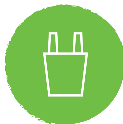
torba na zakupy